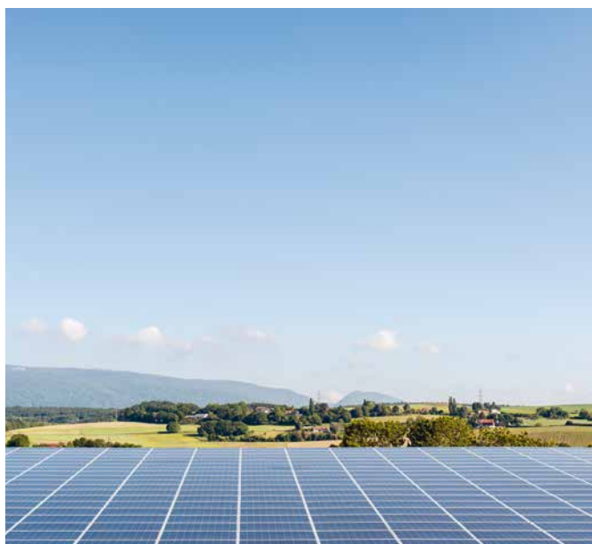
Zwei Gebäude von Ecorecyclage in Lavigny mit von Agena installierten Solarzellen.

Der Neubau in Forel (Lavaux) befindet sich auf der Zielgeraden. Ab Dezember 2015 werden dort die 274 Mitarbeitenden der in den Bereichen Sanitär-, Heiz- und Lüftungstechnik tätigen Gesellschaften untergebracht sein. Durch diese Zusammenführung können langfristig vor allem administrative Dienste zusammengelegt werden, wobei jedes der betroffenen Unternehmen seine operative und branchenspezifische Unabhängigkeit bewahren wird.