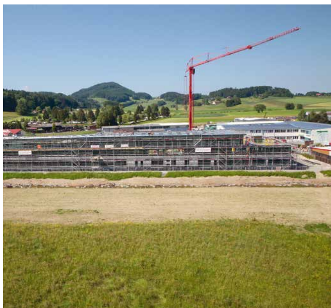
Das neue Gebäude, in dem die Mitarbeitenden von J. Diémand, Brauchli, Roos Ventilation und Taxa untergebracht sein werden, ist 120 m lang und weist eine Fläche von mehr als 5600 m 2 auf.